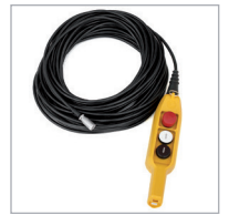
Botonera con 15 ó 30 m. de cable opcional / Optional hand control with 15 or 30 m. of cable